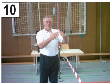
10 Ballberührung + Treffer