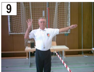
9 Mehr als 3 Ballkontakte durch diese Mannschaft + Treffer