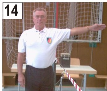
14 Treffer + anderes Handzeichen