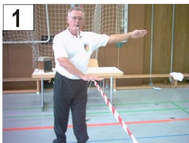
1 Übergreifen, Ballkontakt in der anderen Spielfeldhälfte + Treffer