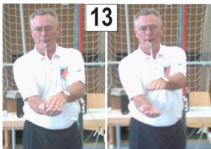
13 Körper hatte beim Spielen des Balles über das Band keinen Bodenkontakt + Treffer