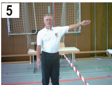
5 Fehler + Treffer