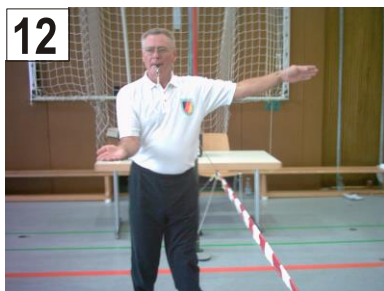
12 Verzögerung des Schlages (Heben, Tragen, Werfen oder Führen) + Treffer