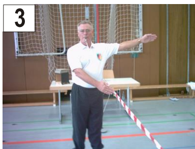
3 Band Fehler + Treffer