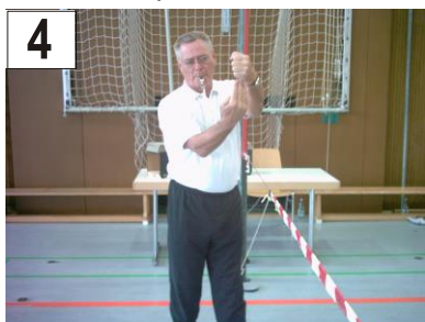
4 Spiel mit dem Unterarm + Treffer