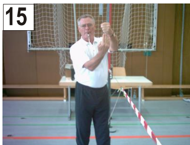
15 Schlag mit der Faust oder Handkante + Treffer