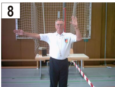
8 5 Sekunden Verzögerung bei Angabe oder Ballübergabe + Treffer