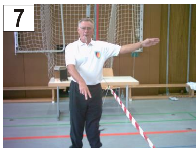
7 Mehr als ein Bodenkontakt des Balles + Treffer