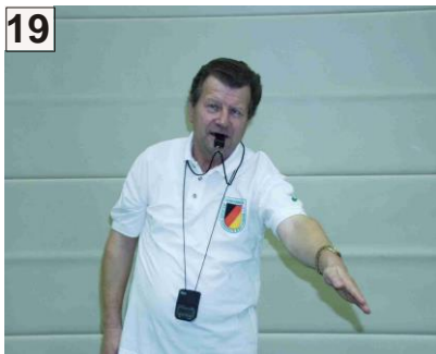
19 Übergetreten und Anzeige des Treffers