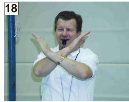
18 Spielende oder Halbzeit