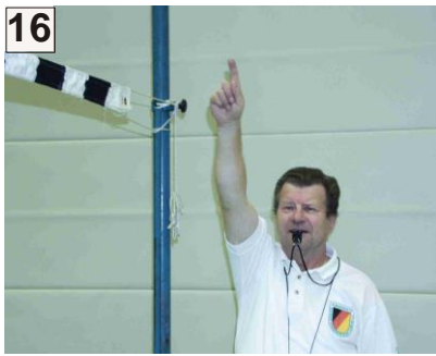
16 Deckenberührung (Halle) und Anzeige des Treffers